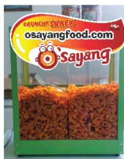
O Sayang 零食