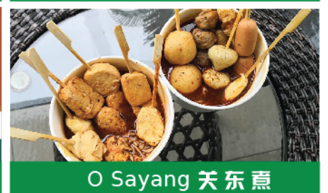
O Sayang 关东煮