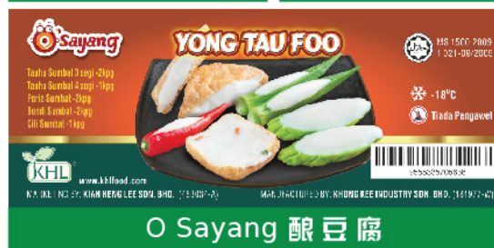
O Sayang 酿豆腐